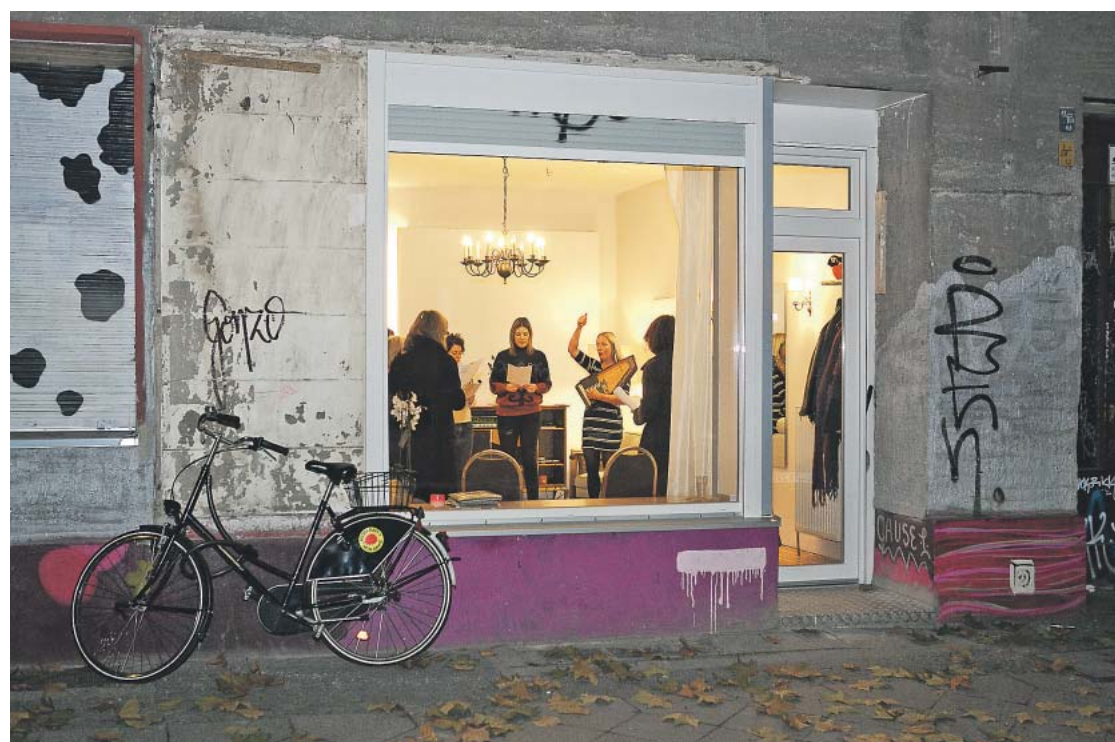
Kreuzberger Clash der Kulturen: In der Jodelschule brennt noch Licht. Passanten bleiben gerne mal stehen.

als Schauspielerin, zum Beispiel in dem Film „Die Könige der Nutzholzgewinnung“, für den sie dann auch die Musik komponierte. Sie trat als Tournee-Schauspielerin in Deutschland, Österreich und der Schweiz auf, ebenso wie in Musicals etwa über die Band Ramones oder Johnny Cash. Zwischendurch kellnerte sie auch immer wieder.